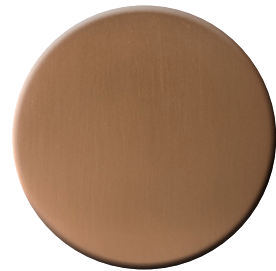
RS SuperRame satinato SuperCopper satin