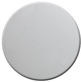
CR Cromo lucido Bright chrome