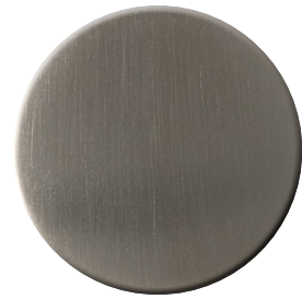
IS SuperInox satinato SuperStainlessSteel satin