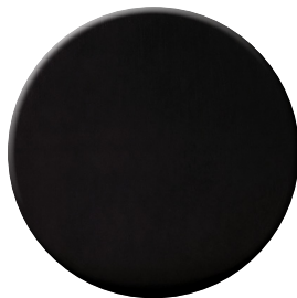
NP Nero opaco Mat black