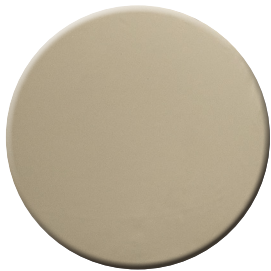
NL SuperNichel lucido SuperNickel bright