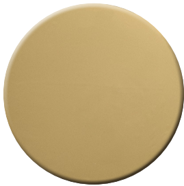
ZL SuperOro lucido SuperGold bright