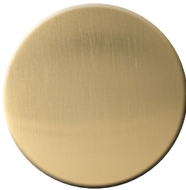
TS SuperOro satinato SuperGold satin