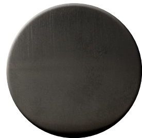
US SuperAntracite satinato SuperAnthracite satin