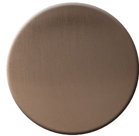
DS SuperBronzo satinato SuperBronze satin